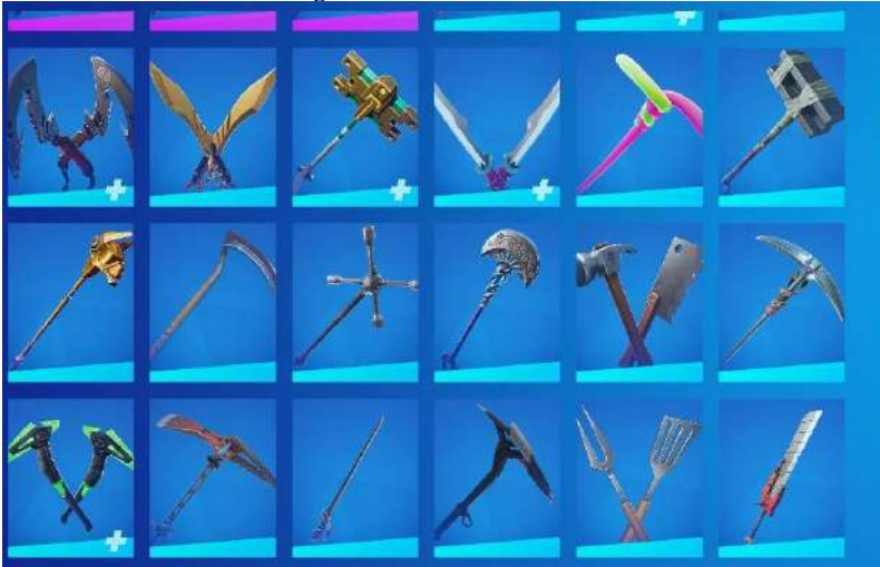
Imagem 6: Picareta Fortnite.