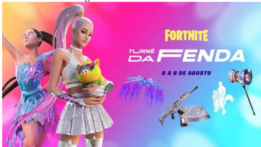
Imagem 3: Skin de Ariana Grande