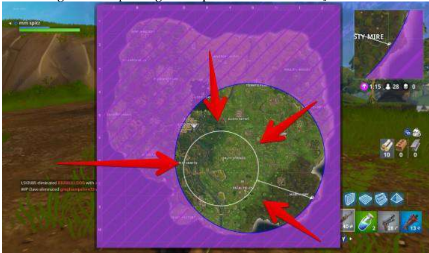
Imagem 8: Mapa do game representando mudança do círculo.