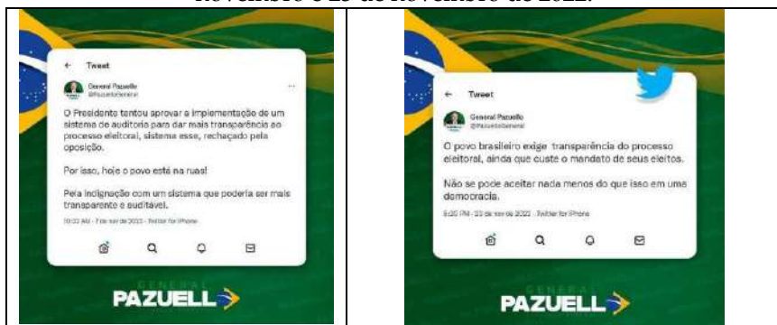
Tabela 3 – Publicações no Facebook do General Pazuello nos dias 7 de novembro e 23 de novembro de 2022.

Fonte: < https://www.facebook.com/photo/?fbid=173386472037204 > e < https://www.facebook.com/photo/?fbid=177832464925938 >. Acesso em: 01/10/2024.