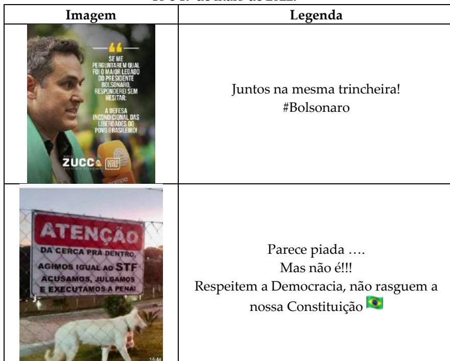
Tabela 4 – Publicações no Facebook do Tenente Coronel Zucco nos dias 18 e 19 de maio de 2022.