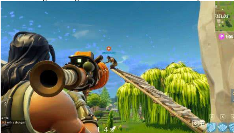
Imagem 7: Jogador de Fortnite construindo rampa.