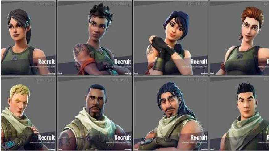
Imagem 1: Skins Default.