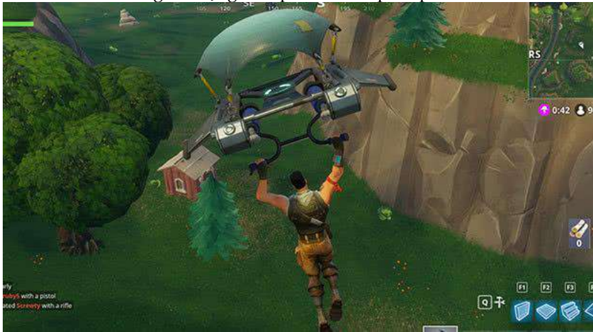
Imagem 5: Jogador pulando de paraquedas.