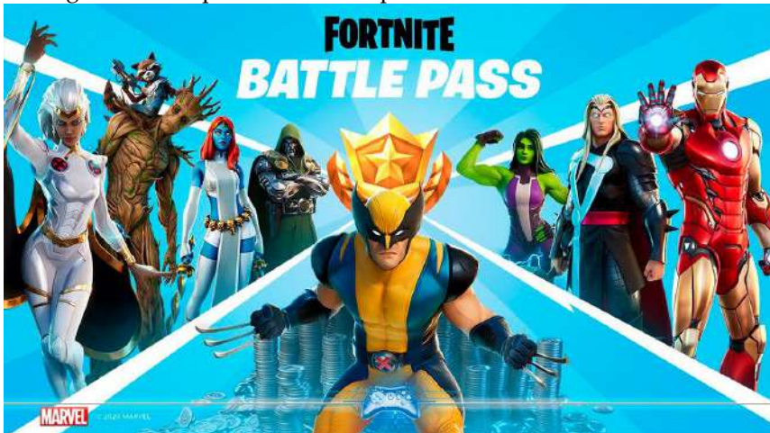
Imagem 2: Skins provenientes do passe de batalha da Marvel Comics.