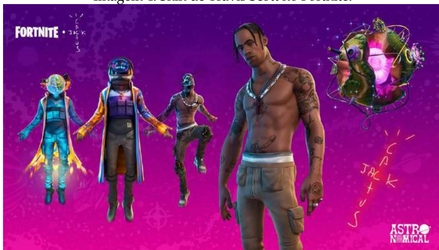
Imagem 4: Skin de Travis Scott no Fortnite.